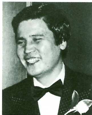
リサイタルによせて