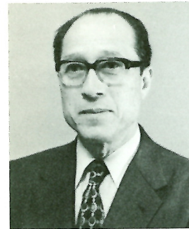
法政大学教授 軽音楽グループ部長