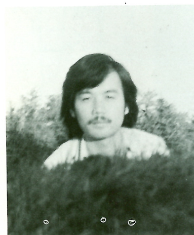
コンサートマスター